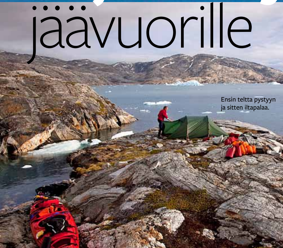
Ensin telttä pystyyn ja sitten iltapalaa.

Y htäkkinen pauke ja jylinä ovat kuin sotatantereelta. Yksi ympärillä olevista jäävuorista on hajonnut, ja lohkarleet ovat pudonneet Grönlannin hyiseen mereen.